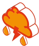
INONDAZIONE ED ESONDAZIONE